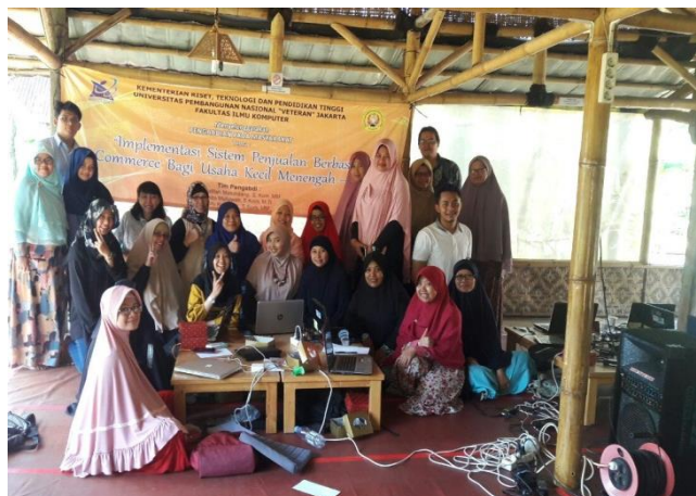
Gambar 2. Foto bersama setelah pelaksanaan kegiatan membuat website dan gerai on-line