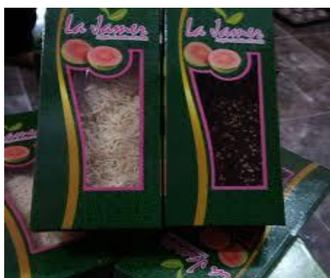
Gambar 3. Lapis Bolu Jamer