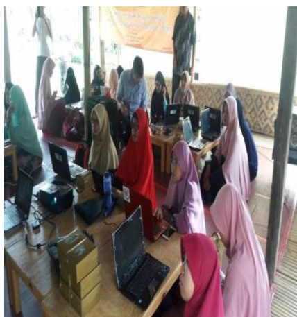
Gambar 1. Pelaksanaan kegiatan membuat website dan gerai on-line