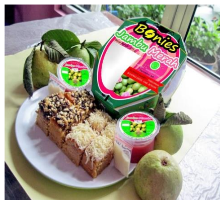
Gambar 1. Puding Jamer