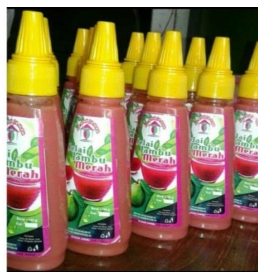
Gambar 4. Selai Jamer