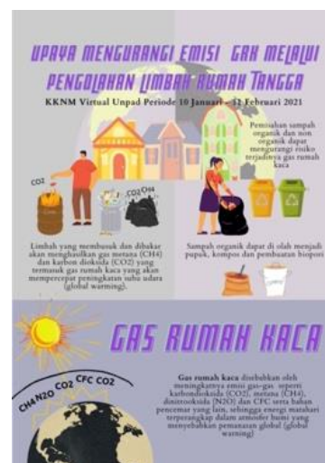
Gambar 1. E-flyer Emisi Gas Rumah Kaca

terbesar untuk CH 4 dan N 2 O. Estimasi emisi Gas Rumah Kaca (GRK) secara global yang diakibatkan oleh industri peternakan berkisar dari 8 hingga 51% (Herrero et al. , 2011). Oleh karena itu, beberapa upaya harus dilakukan di dalam mengelola limbah peternakan sebagai sumber emisi gas rumah kaca, diantaranya pengolahan limbah ternak menjadi pupuk organik melalui pengomposan. Hasil penelitian menyatakan bahwa proses pengomposan limbah ternak secara nyata dapat mereduksi emisi CH 4 dari limbah padat (Petersen, 2020). Penjelasan mengenai emisi gas rumah kaca ditampilkan melalui e-flyer seperti yang disajikan pada Gambar 1.