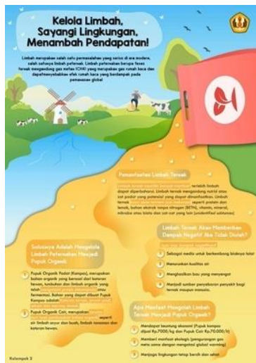
Gambar 2. E-flyer Pengolahan limbah menjadi Pupuk Organik

cara mengirimkan materi penyuluhan berupa prosedur pembuatan pupuk organik padat (kompos dan vermikompos) dan pupuk organik cair. Materi penyuluhan dikemas melalui tayangan e-flyer dan video tentang pengolahan limbah ternak secara terpadu. Tampilan e-flyer dapat dilihat pada Gambar 2. dan cuplikan video ditampilkan pada Gambar 3.