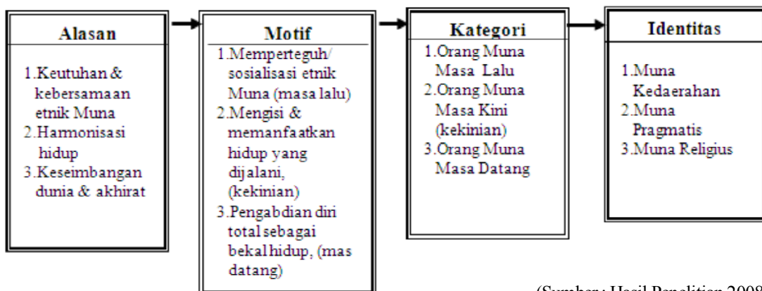
Gambar 1. Model Kategori Identitas Orang Muna

Proses identifikasi identitas etnik orang Muna di Bandung berlangsung dalam 2 (dua) konteks, mekanisme tahapan yang dilakukan melalui media sosialisasi. Proses tersebut merupakan konstruksi identitas etnik orang Muna, baik dalam konteks intra etniknya maupun antaretnik di Bandung. Mekanisme tersebut meliputi proses komunikasi intrapersonal dan proses komunikasi interpersonal dalam keluarga, komunitas dan masyarakat, seperti pada tabel 1.