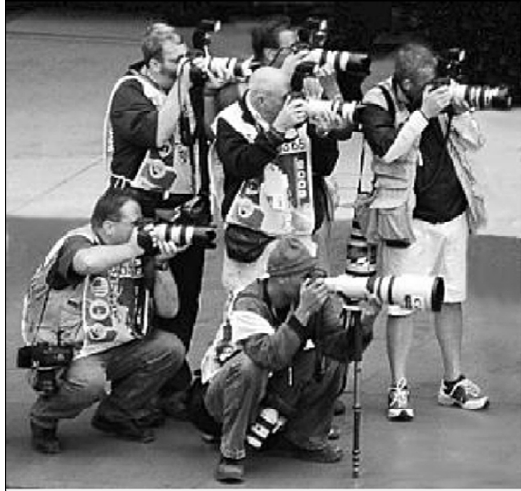
Gambar 1. Para jurnalis foto yang dibekali dengan peralatan fotografi yang canggih, apalagi ketika meliput acara olah raga.

terciptanya kemajuan fotografi dengan pesat (termasuk perfilman dan video untuk pemberitaan).