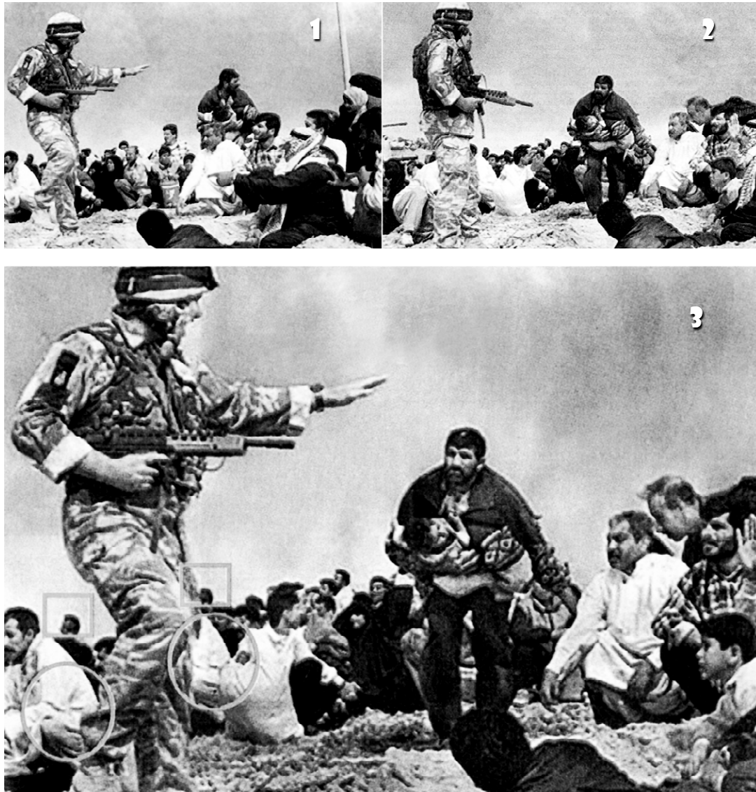
Gambar 6. Foto 1 dan 2 merupakan foto asli Walski yang digabungkan menjadi sebuah foto jurnalistik yang mempunyai latar belakang yang kuat, yaitu Perang Teluk II (bawah). Adegannya menampilkan seorang Marinir Inggris sedang mengatur beberapa warga sipil Irak yang tampaknya sedang mengungsi. Pose si marinir sangat fotogenik, tegas dan berwibawa. Sementara pengungsipun tampil meyakinkan dengan adanya pusat perhatian pada seorang bapak yang menggendong anaknya. Tapi lihat pada bagian yang ditandai.