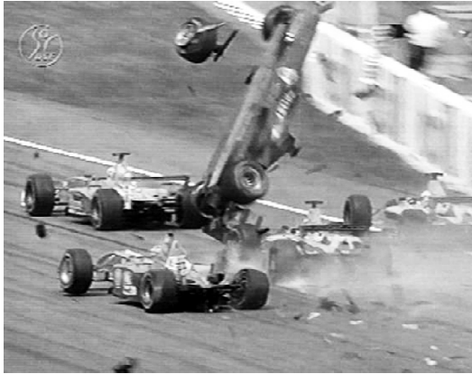
Gambar 4. Jenis foto “spot news” yang menceritakan peristiwa tunggal.

isinya menunjukkan penyakit masyarakat yang perlu mendapat perhatian pemerintah maupun masyarakat itu sendiri.