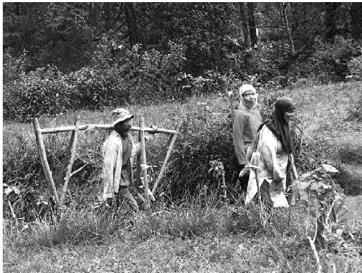
Gambar 5. Jenis foto “human interest” adalah tema foto yang bercerita seputar kehidupan manusia.

isinya menunjukkan penyakit masyarakat yang perlu mendapat perhatian pemerintah maupun masyarakat itu sendiri.