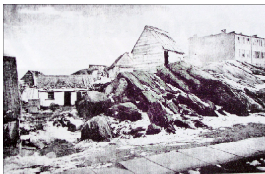
Gambar 3. Foto tambang pengeboran minyak Shantytown oleh Henry J. Newton (sumber : Fotomedia edisi April 2003).

Sejalan dengan teknologi dunia cetak, akhirnya foto bisa ditransfer ke media cetak massal. Foto pertama di surat kabar adalah foto tambang pengeboran minyak Shantytown yang muncul di surat kabar New York Daily Graphic di Amerika