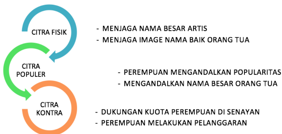
GAMBAR 6. Pola Perkiraan Masalah Detik.Com

adalah orang-orang populer apakah karena faktor keartisannya atau posisinya sebagai incumben maupun karena kedekatannya dengan pejabat penting. Upaya pendekatan yang dilakukan dalam meraih simpati caleg perempuan melakukan dengan memperhatikan penampilannya, mendatangi tempat-tempat yang bisa meraih suara terbanyak, bahkan melakukan demonstrasi untuk memenuhi kuota 30 persen. Sedangkan konflik yang timbul pada saat kampanye adalah seputar tuduhan memanfaatkan nama besar soeharto, kepopuleran tokoh yang diperankan dan pelanggaran kampanye.