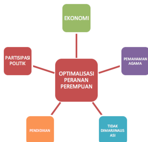
GAMBAR 8. Rekomendasi Penyelesaian Detik.Com

Secara umum rekomendasi penyelesaian yang diajukan oleh Detik.Com adalah membuat pemetaan bagaimana caleg perempuan dapat menjadi anggota parlemen agar memaksimalkan peranan perempuan baik