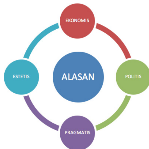
GAMBAR 3. Pola Keputusan Moral Kompas.Com

Framing keempat dari Entman adalah treatment recommendation (menekankan penyelesaian). Elemen ini dipakai untuk menilai apa yang dikehendaki oleh wartawan. Jalan apa yang dipilih untuk menyelesaikan masalah. Penyelesaian itu tentu saja sangat tergantung pada bagaimana peristiwa itu