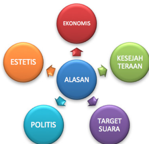
GAMBAR 7. Keputusan Moral Detik.Com

Secara umum keputusan moral yang diajukan oleh Detik.Com adalah bahwa alasan caleg perempuan menjadi anggota legislatif peneliti dikelompokkan menjadi alasan ekonomis karena ingin mengangkat kaum perempuan bangkit dari kemiskinan, alasan politis karena ingin berkiprah memperjuangkan perempuan dan ingin menunjukkan bahwa perempuan tidak akan melakukan 'korupsi', alasan pragmatis untuk mendapatkan suara dan mendukung program partai serta alasan estetis karena ingin memajukan seni tradisional.