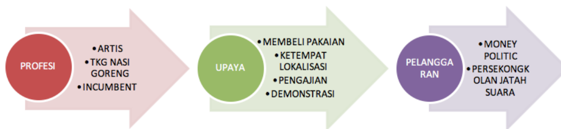
GAMBAR 1. Pola: Definisi Masalah Kompas.Com

menyangkut profesi caleg perempuan, dari kalangan artis, penyanyi, model, incumbent , adik gubernur dan penjual nasi goreng. Hal lain adalah tentang upaya caleg perempuan dalam menarik minat. Selanjutnya, definisi masalah lain yang muncul citra caleg perempuan adalah perihal caleg yang dilaporkan karena diduga melakukan pelanggaran dan kecurangan. Jika digambarkan maka modelnya citra yang dimunculkan dalam pendefinisian masalah dapat dilihat pada gambar 1.