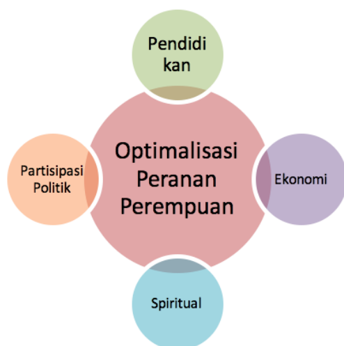
GAMBAR 4. Pola Rekomendasi Penyelesaian Kompas.Com

dilihat dan siapa yang dipandang sebagai penyebab masalah. Dalam konteks penelitian adalah diasumsikan sebagai solusi moral apa yang ditekankan media ketika mengangkat berita tentang caleg perempuan.