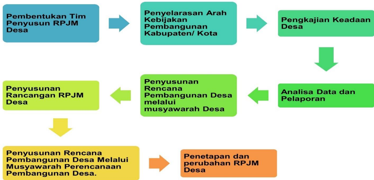
Gambar 1 Tahapan Penyusunan RPJM Desa