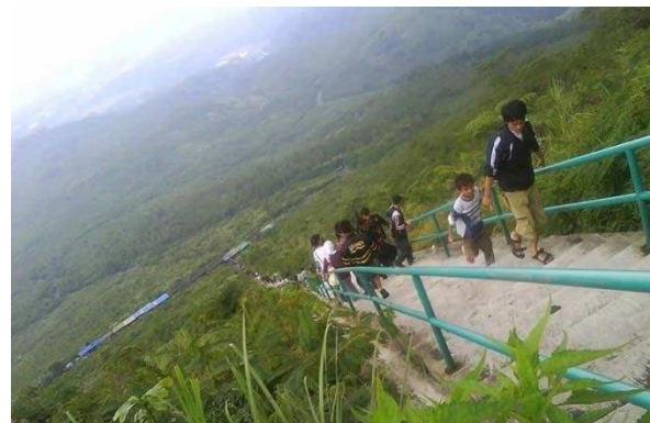
Gambar 2 Wisata Gunung Galunggung

Pengembangan dampak wisata Gunung Galunggung ini akan berdampak sangat luas dan signifikan dalam pengembangan ekonomi upaya-upaya pelestarian sumber daya alam dan lingkungan serta akan berdampak terhadap kehidupan sosial budaya masyarakat terutama masyarakat lokal.