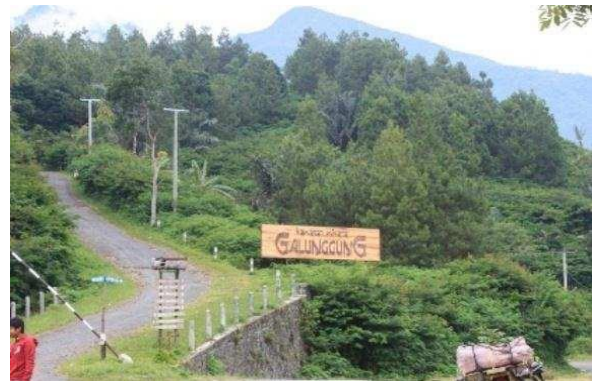
Gambar 1 Potensi Wisata Gunung Galunggung

wisata yang ditawarkan antara lain obyek wisata dan daya tarik wanawisata dengan areal seluas kurang lebih 120 hektar di bawah pengelolaan Perum Perhutani. Obyek yang lainnya seluas kurang lebih 3 hektar berupa pemandian air panas (Cipanas) lengkap dengan fasilitas kolam renang, kamar mandi dan bak rendam air panas.